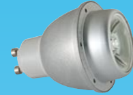
LED 1 W Gu10, 230 V spot 20°