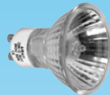
Halogenlampa 35 W, Gu10, 230 V, spot 30°