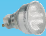
Energylampa 7 W Gu10, 230 V Wide beam